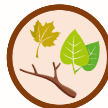
Déchets d'entretien du jardin