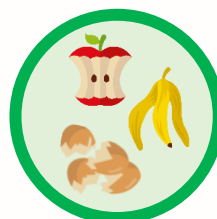
Déchets de cuisine et de table